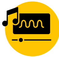
Arrangiamento & Songwriting